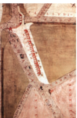
Bourg Marghera, s. XVII